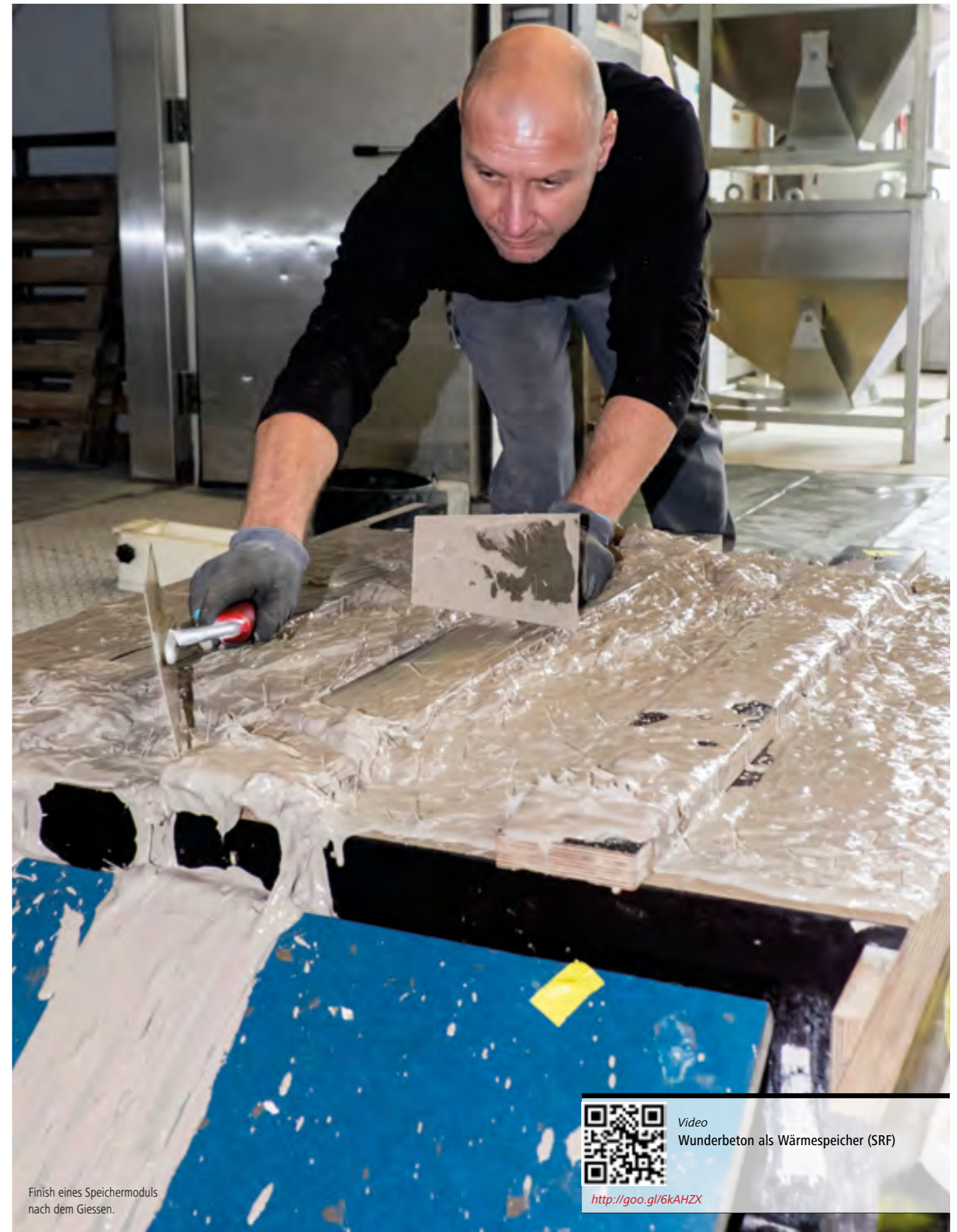
Finish eines Speichermoduls nach dem Giessen.

Ein weiteres Experiment war die unbelüftete Blechdachkonstruktion mit einer variablen Dampfbremse. Diese damals neuartige Folie verhindert im Winter dank erhöhtem Diffusionswiderstand, dass zu viel Feuchtigkeit in die Dachkonstruktion eindringt und