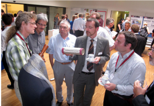
L'exposition parallèle présentait aussi des innovations textiles.