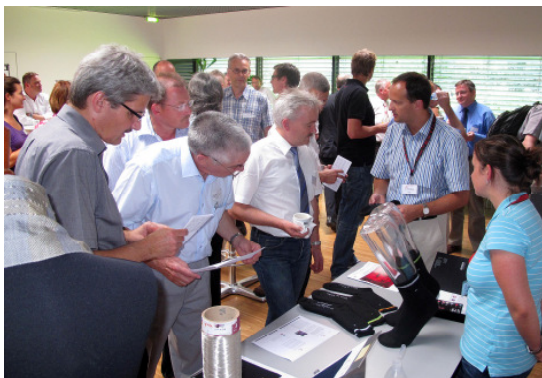
Les nouvelles chaussettes militaires, un projet d'armasuisse et de l'Empa, étaient aussi présentes.