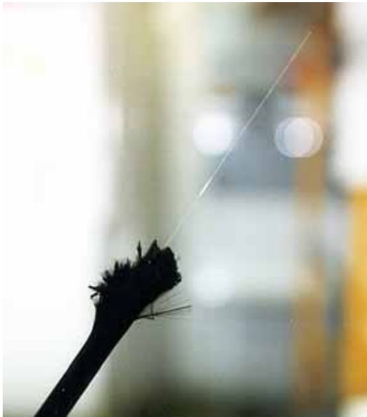
Fil de fibres de carbone avec un capteur optique en son centre.