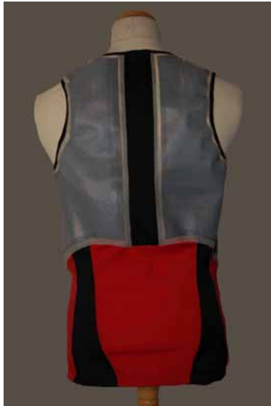
Un maillot de corps réfrigérant d'Unico swiss tex GmbH équipé du système Empa. Les surfaces grises sont en tissu stratifié que se remplit d'eau.