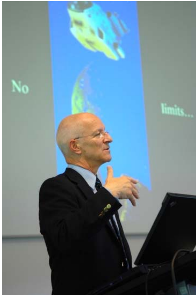
Claude Nicollier während seiner Präsentation